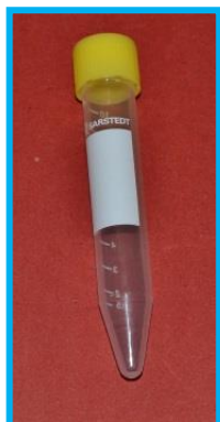
Tube conique ACCEPTABLE pour l'analyse d'urine ACCEPTABLE conical tube for urinalysis

Please note that as of Monday, September 6 th , 2021 , the Central Laboratory – Glen Site will only be accepting urine specimens for urinalysis testing if they are received in the appropriate conical tube. We will no longer be accepting urine specimens for urinalysis that are sent in urine cups.